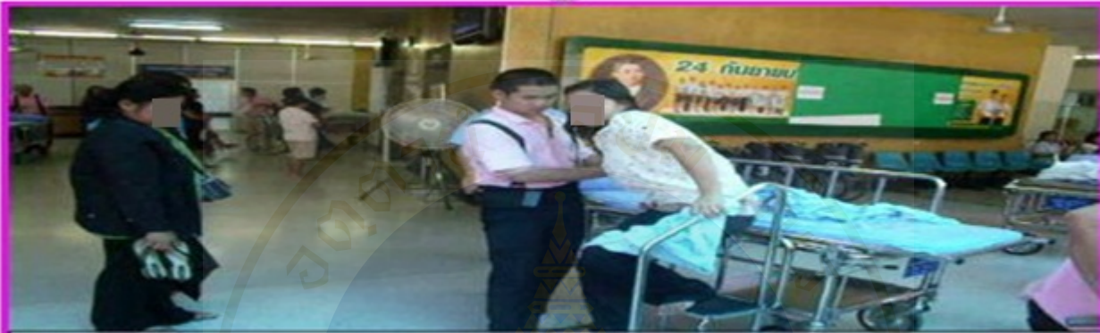
โครงการ "สะดวกปลอดภัยด้วยบันไดนกแอร์"