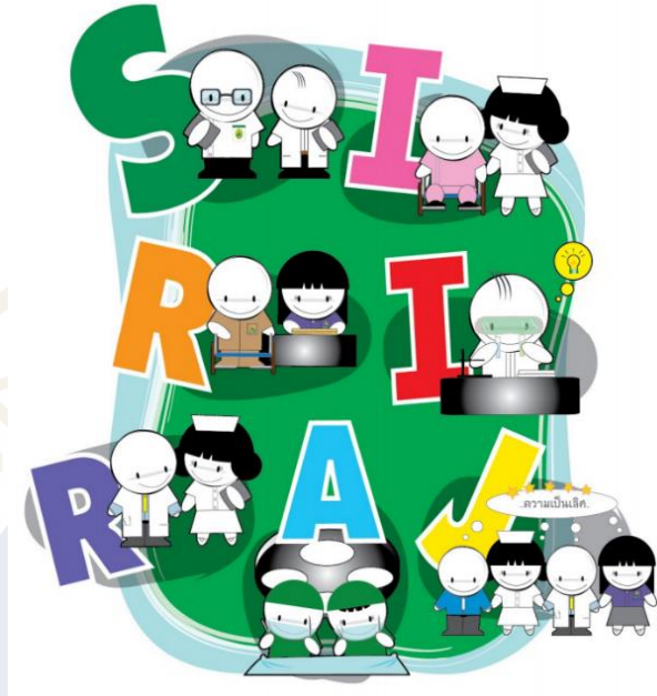
ภาพที่ 2 ภาพวัฒนธรรม SIRIRAJ

ตัวอย่างการเปรียบเทียบให้เห็นภาพ (imagery) ในแต่ละตัวอักษรของวัฒนธรรม SIRIRAJ