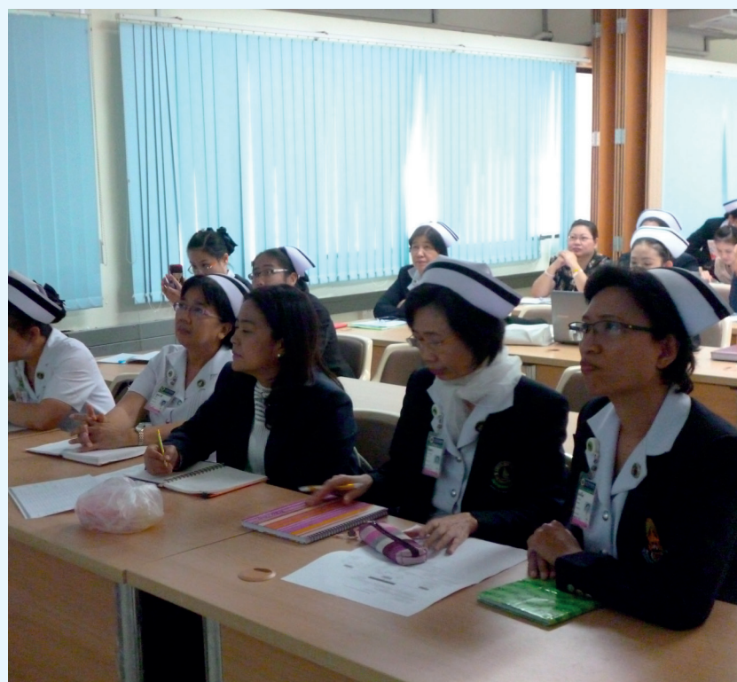
concurrent trigger tool